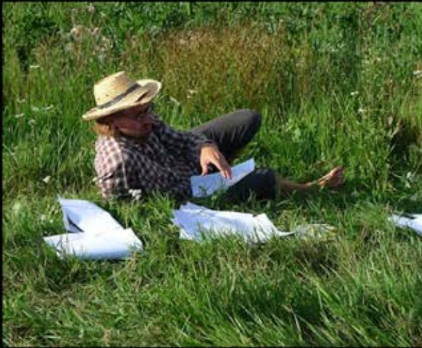
What my friends think I do