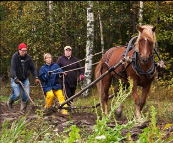
What Agri-business thinks I do