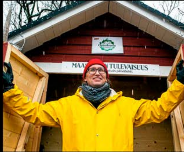
What society thinks I do