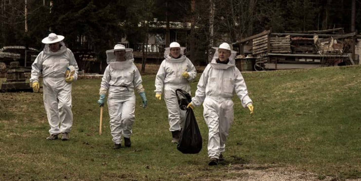
Oman pellon mehiläistarhaajat