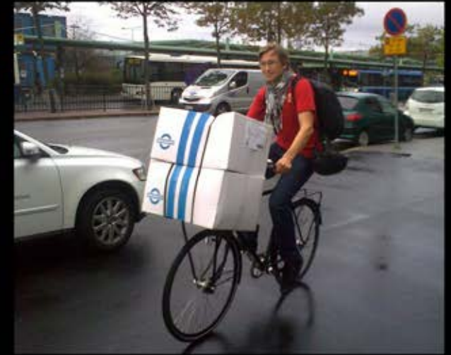
What my spouse thinks I do