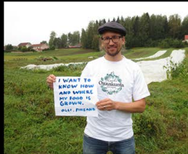
What I think I do