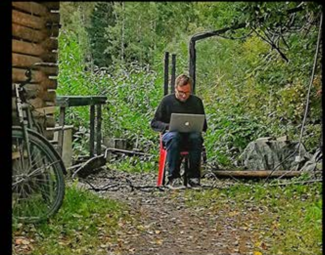
What I actually do